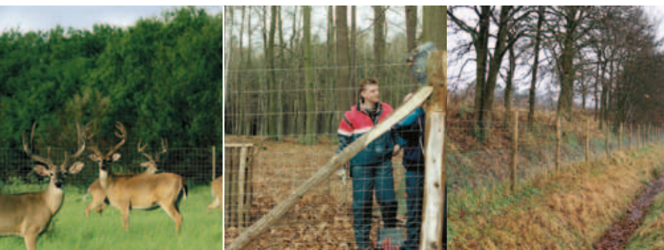
Ursus AS Super